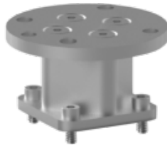
0244496 TBD1, Robot fixture kit D.50mm ISO, Ø50mm, 4x M6, hoogte 34mm