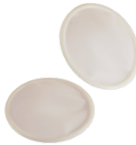
FRZN-030 045.030.040.121 Nylon filter, Ø30mm, voor balgzuignappen