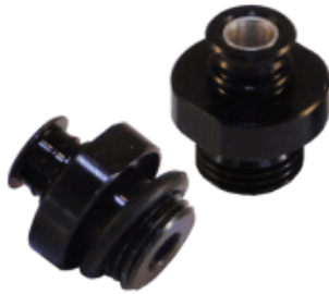
N050 G1/8-AG 040.01.702.106 G1/8"AG, kraag Ø14 mm, met O-ring en geïntegreerd filter