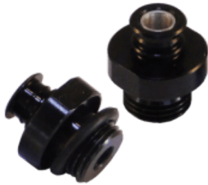
N050 G1/8-AG 040.01.702.106 G1/8"AG, kraag Ø14 mm, met O- ring en geïntegreerd filter