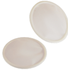
FRZN-030 045.030.040.121 Nylon filter, Ø30mm, voor balgzuignappen