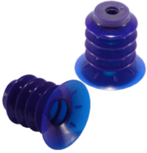
VGB4-XP35P-PU-Flex (DUO) 410.035.210.13 Ø 35 mm, HF = 11,6 N, veerweg = 22,0 mm, PU-Flex (DUO), 30-55° shore A (licht/donker blauw)