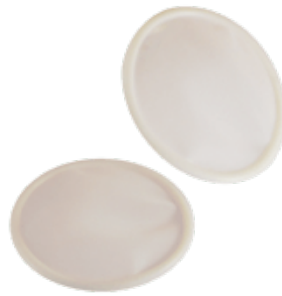
FRZN-030 045.030.040.121 Nylon filter, Ø30mm, voor balgzuignappen