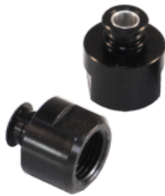
N050 G1/8-IG 041.01.703.106 G1/8"IG, kraag Ø14 mm, met geïntegreerd filter