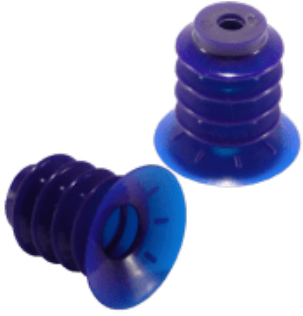
VGB4-XP35P-PU- Flex 410.035.210.12/60BL Ø 35 mm, HF = 11,6 N, veerweg = 22,0 mm, PU-Flex, 60° shore A (donker blauw)