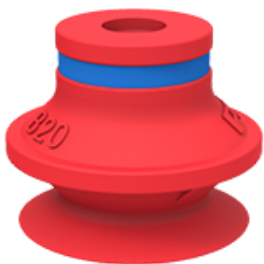
Suction cup B20.20 0101102 Ø 22 mm, HF = 9,8 N, veerweg = 10,0 mm, zonder nippel, SI (50°)